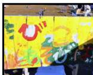
石巻ゴモプロジェクト