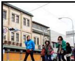
2.0 エクスカーション