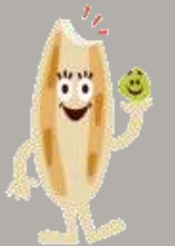
ササカーマちゃん