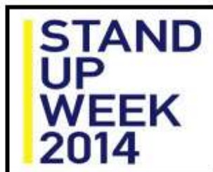
STAND UP WEEK