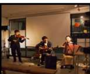
手作りCMプロジェクト