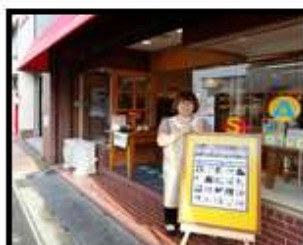
オープン!!イシノマキ