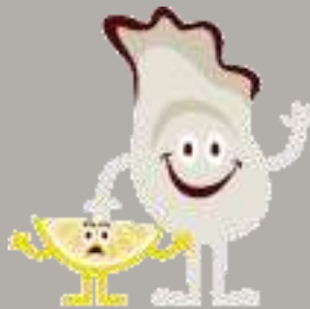
がまおじさんと レモンちゃん